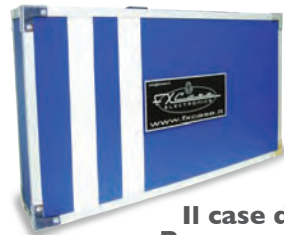
Il case della Programmable in stile anni '70